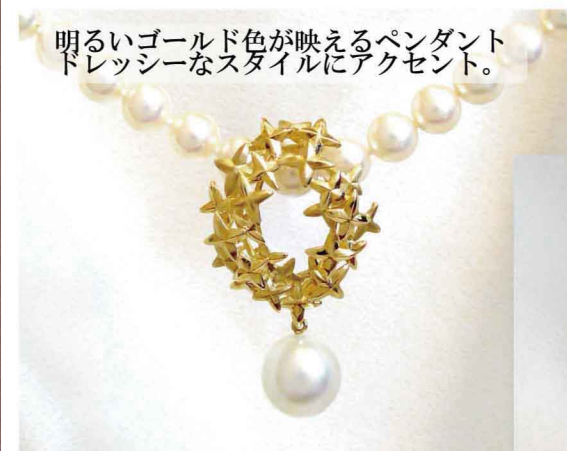
明るいゴールド色が映えるペンダント ドレッシーなスタイルにアクセント。