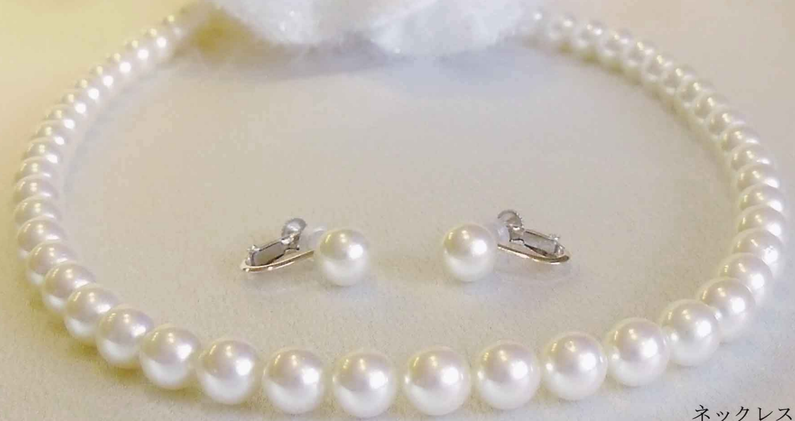
ネックレス (7.5 mm) イヤリング (7.5 mm) 2点セット ¥256,000-(税込)