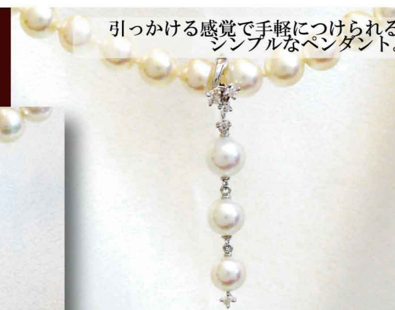
引っかける感覚で手軽につけられる シンプルなペンダント。

ロングパールを華やかに演出させる ショートナー。2wayにブローチと しても使えるのでいつでも活躍できる。