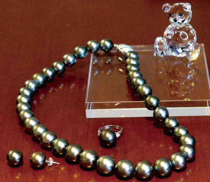
ネックレス：9.5 mm～12 mm ¥460,000(税込) リング：K18YG ダイヤ 13.8 mm ¥260,000(税込) ピアス：K14WG 12 mm ¥140,000(税込)

ゴールドの色素をもった白蝶貝から取れる ゴールデンパール。自然のぬくもりを感じ させる肌馴染みの良いこの色味は、いつも の装いにノーブル感をプラスする。